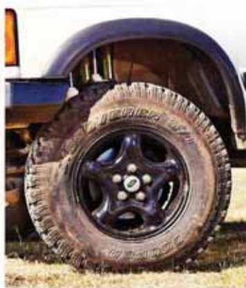
8 Des jantes de Discovery Td5 SE de 8 pouces de large sont cordées de Cooper Discoverer ST en 265/75 R16, un pneu plébiscité par les pistards, sachant s'attaquer ponctuellement à la boue sans rougir.

Avec cette configuration Stéphane Leuner et les Barrois sont parvenus à un compromis offrant des croisements de ponts sérieux, une tenue de cap optimale sur piste tout en obtenant un comportement routier proche de celui d'origine malgré l'importante rehausse et l'élévation du centre de gravité due à l'installation de la tente. De plus, la pose du kit ne demande pas de soudures fastidieuses, ne réclamant qu'une découpe dans le passage d'aile et l'élargissement du diamètre d'un passage de boulon de la barre stabilisatrice avant, qui disparaît au passage. Ces emplacements de fixation reçoivent les