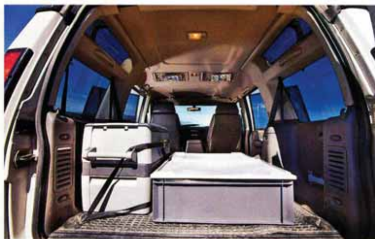
9 L'arrière de l'habitacle, rendu vaste par la suppression de la banquette, évolue en fonction des destinations : équipé "raid" avec coffres, réfrigérateur et jerrycans pour les voyages ou bardé de pièces et d'outillage effectuant l'assistance du 90 lors des sorties en trial, ou vide pour une utilisation quotidienne.

Pare-chocs avant Scorpion Racing : 800 € ▶ Barre de direction renforcée Terra-firma : 280 € ▶ Rock sliders : 580 € ▶ Kit complet de suspension Distri 4x4 : 1 500 € ▶ Jantes de Discovery Td5 SE : 250 € d'occasion ▶ 5 Cooper Discoverer ST en 265/75 R16 : 1000 € ▶ Snorkel : 450 € ▶ Reprogrammation Sport System + intercooler : 1 600 € ▶ Filtre Green : 62 € ▶ Collecteur CJM : 535 € ▶ Feux Hella : 130 € ▶ Tente de toit Columbus : 1 000 € d'occasion ▶ Sièges baquets Recaro : 150 € d'occasion